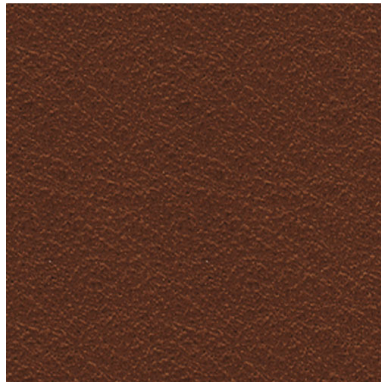
SA 05 braun