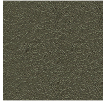
SA 04 oliv