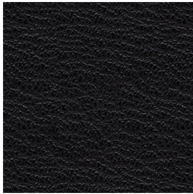
SA 01 schwarz